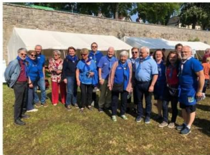
Auf weitere 100 Jahre! Gut Pfad