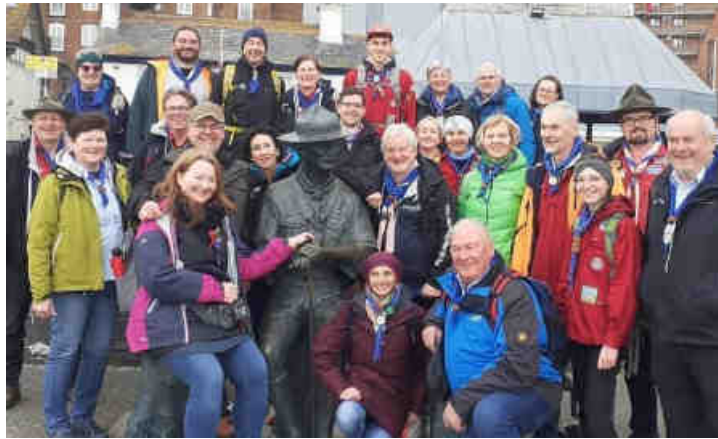
Die Gruppe vor der BP-Statue in Poole