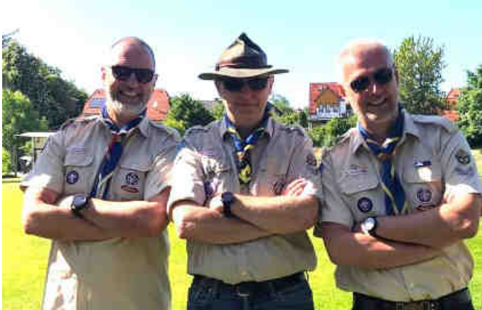
Die Gruppenführung ist zufrieden

Die Gilde Gföhl feierte mit der Pfadi-Gruppe und unterstrich damit die enge Verbundenheit. Eine Waldviertler Erfolgsgeschichte!