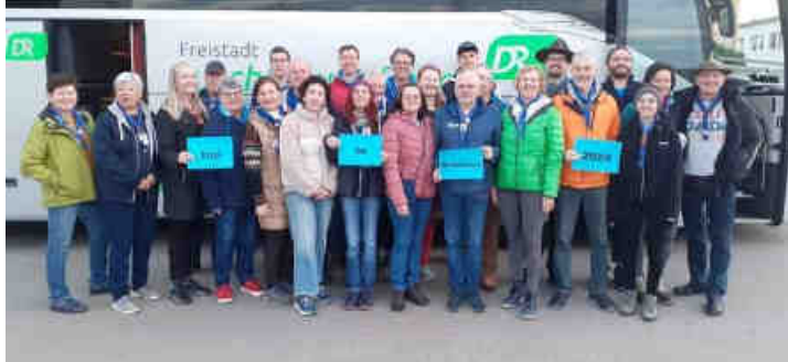
Bereit zur Abfahrt

Die Gilde Freistadt und der Elternrat der Pfadfindergruppe unternahmen eine Reise nach Süd-England mit dem Höhepunkt „Besuch der Insel Brownsea“.