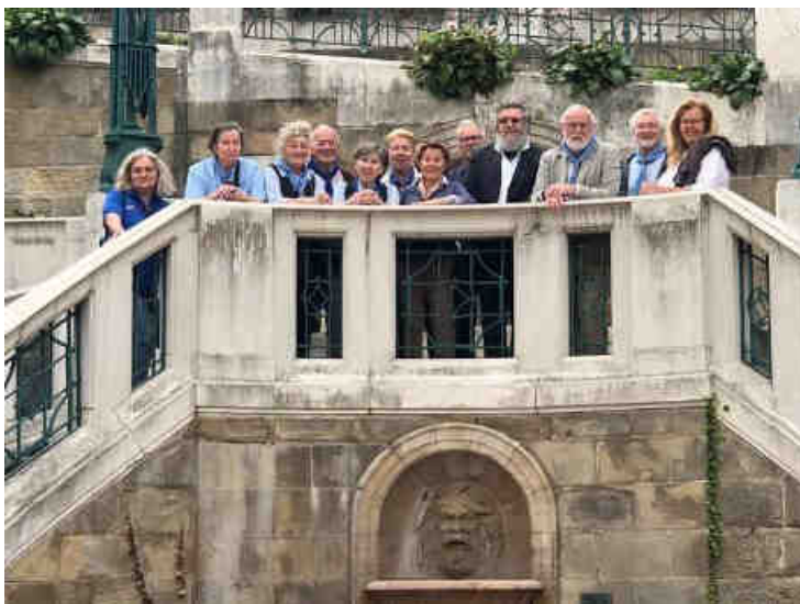
Auf der Strudelhof-Stiege ein kurzer Aufenthalt im Gedenken an Heimito von Doderer

Emausgang der Gilde Markgraf Leopold durch den 9. Bezirk.