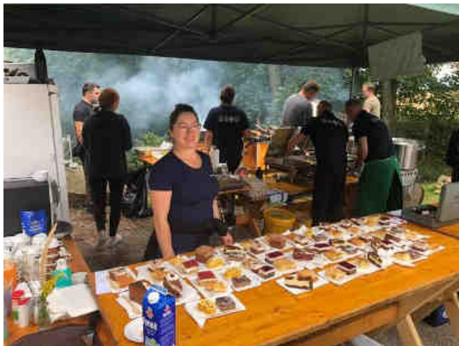
Die Gilde Gföhl sorgt für das leibliche Wohl