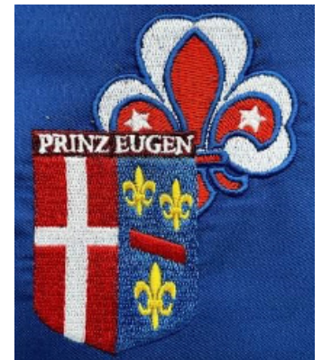
Gildelogo Prinz Eugen