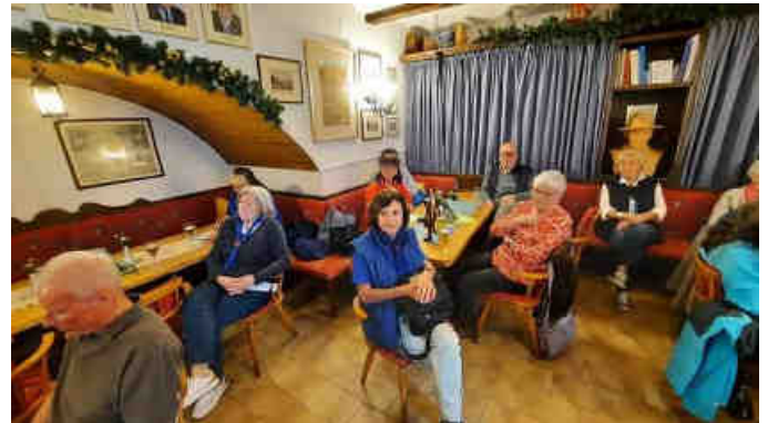
Gäste sind immer willkommen!